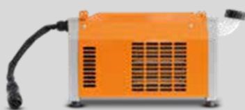
Waterkoeler voor Tiger