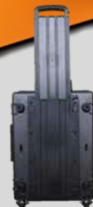
Trolley voor Tiger