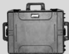
Koffer voor Tiger